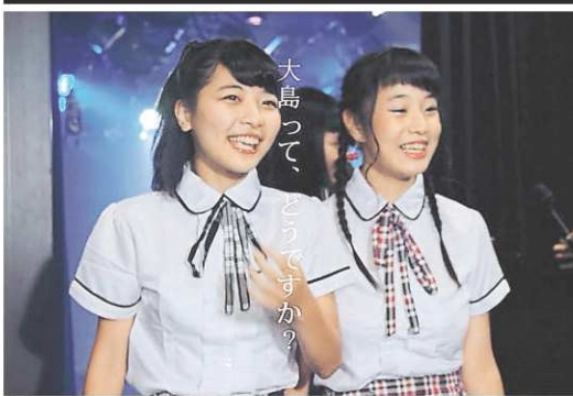
①大島石のアピールへ精力的に活動する石んの会メンバー②「伊予大島石んの会」が立ち上げたホームページ③愛の葉Girlsを起用したP R動画の一場面